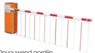
○ Opvouwend gordijn