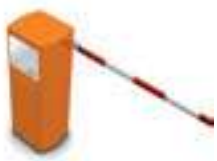
○ Rechte arm