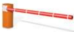
○ Protecta koolstofvezelarm